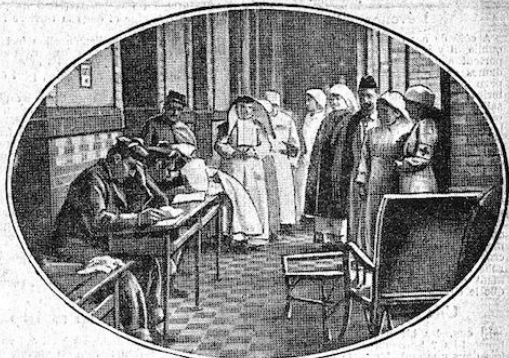
La galerie des convalescents

L'hôpital Buffon, complémentaire du Val-de-Grâce